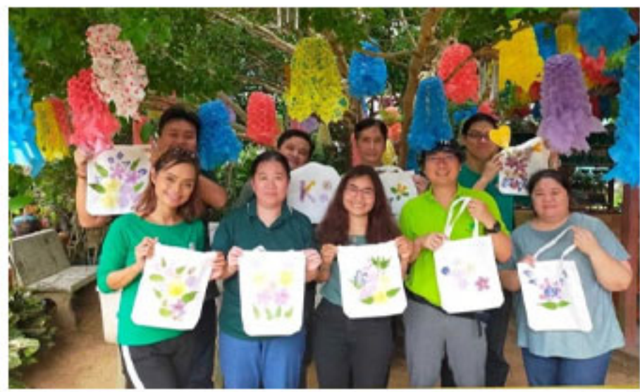
บริษัท เทคโนโลยี อินสตรูเมนต์ จำกัด ได้จัดกิจกรรมตามรอยเส้นทาง "มะพร้าว ณ บ้านตะเคียนเตี้ย อ.บางละมุง จ.ชลบุรี"