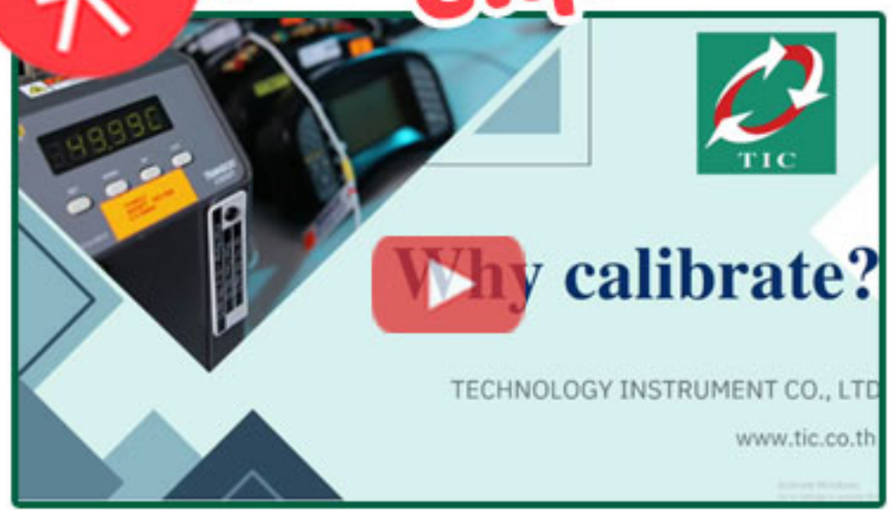
ทำไมต้องสอบเทียบ?